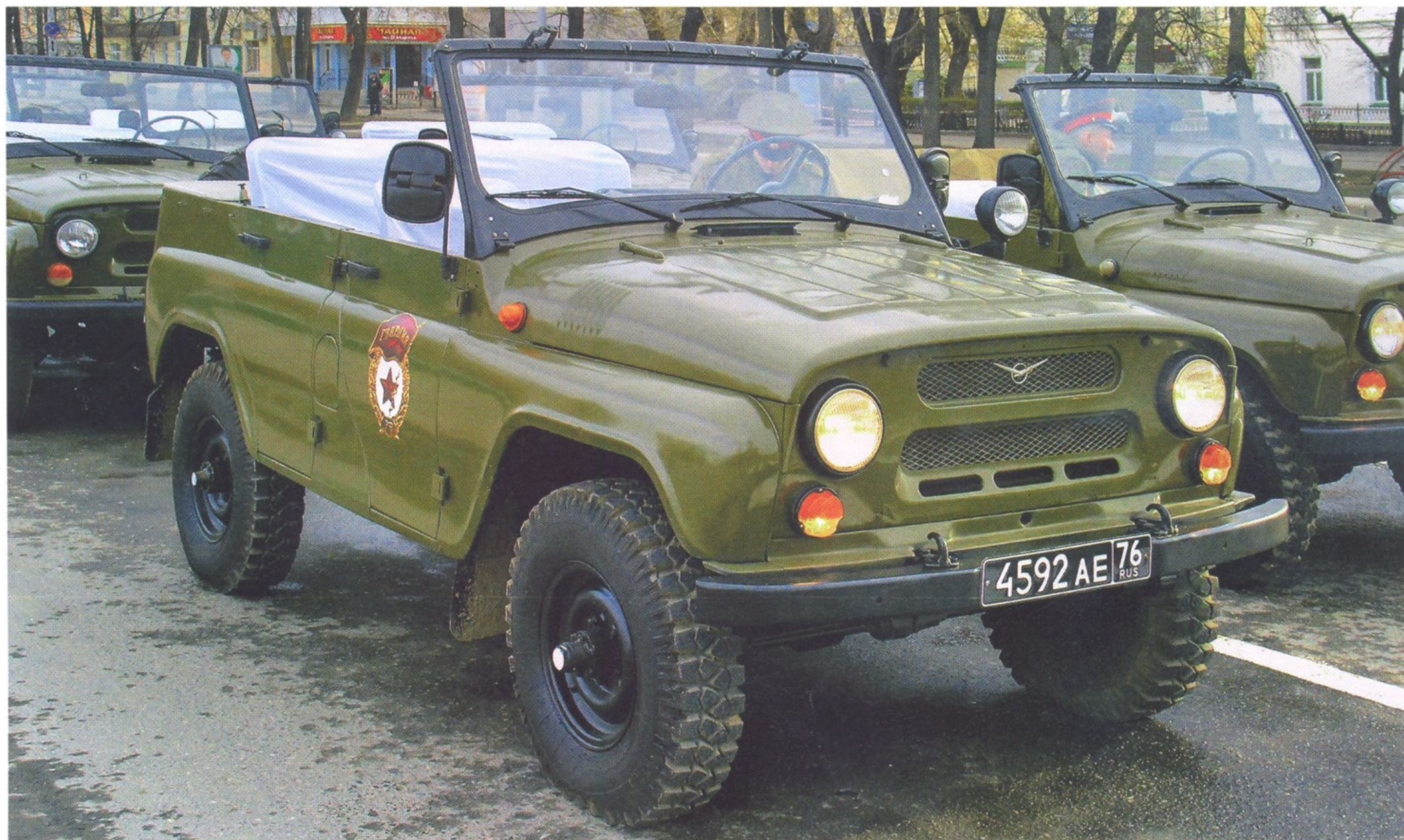
ПРОДУКЦИЯ УЛЬЯНОВСКОГО АВТОМОБИЛЬНОГО ЗАВОДА НА ПАРАДЕ В ЧЕСТЬ ДНЯ ПОБЕДЫ В ЕКАТЕРИНБУРГЕ (2014 ГОД)

Поскольку нефтеперерабатывающая промышленность Советского Союза в то время была в состоянии выпускать лишь ограниченное количество высококачественного автомобильного топлива, большим плюсом этого мотора была его способность устойчиво работать на бензине с низким октановым числом — А-76 и даже А-72. Баков было два, емкость каждого равнялась 32 л. Коробка перемены передач — четырехступенчатая с синхронизаторами на третьей и четвертой передачах. В целом машина, как и задумывали конструкторы, получилась простой, надежной, неприхотливой и при этом обладала прямо-таки феноменальной проходимостью. Однако был у нее и существенный недостаток — салону явно не доставало комфорта. Автомобиль оказался востребованным и широко использовался самыми разными организациями. На базе «гражданской» версии было создано несколько модификаций: УАЗ-469БИ с экранированным электрооборудованием, на котором монтировали радиорелейные приемопередающие УКВ-станции, медицинский УАЗ-469БГ, автомобиль радиационно-химической защиты УАЗ-469Х, почтовый УАЗ-469П и ряд других. Специально для милиции на базе УАЗ-469Б выпускались версии с закрытым металлическим кузовом — УАЗ-469-АДЧ и УАЗ-469АП. Первая предназначалась для выезда оперативных групп на место происшествия, а вторая — для патрульно-постовой службы и ДПС ГАИ. От базовой модели они отличались чуть большими габаритами, а между собой — комплектами установленного на них спецоборудования.