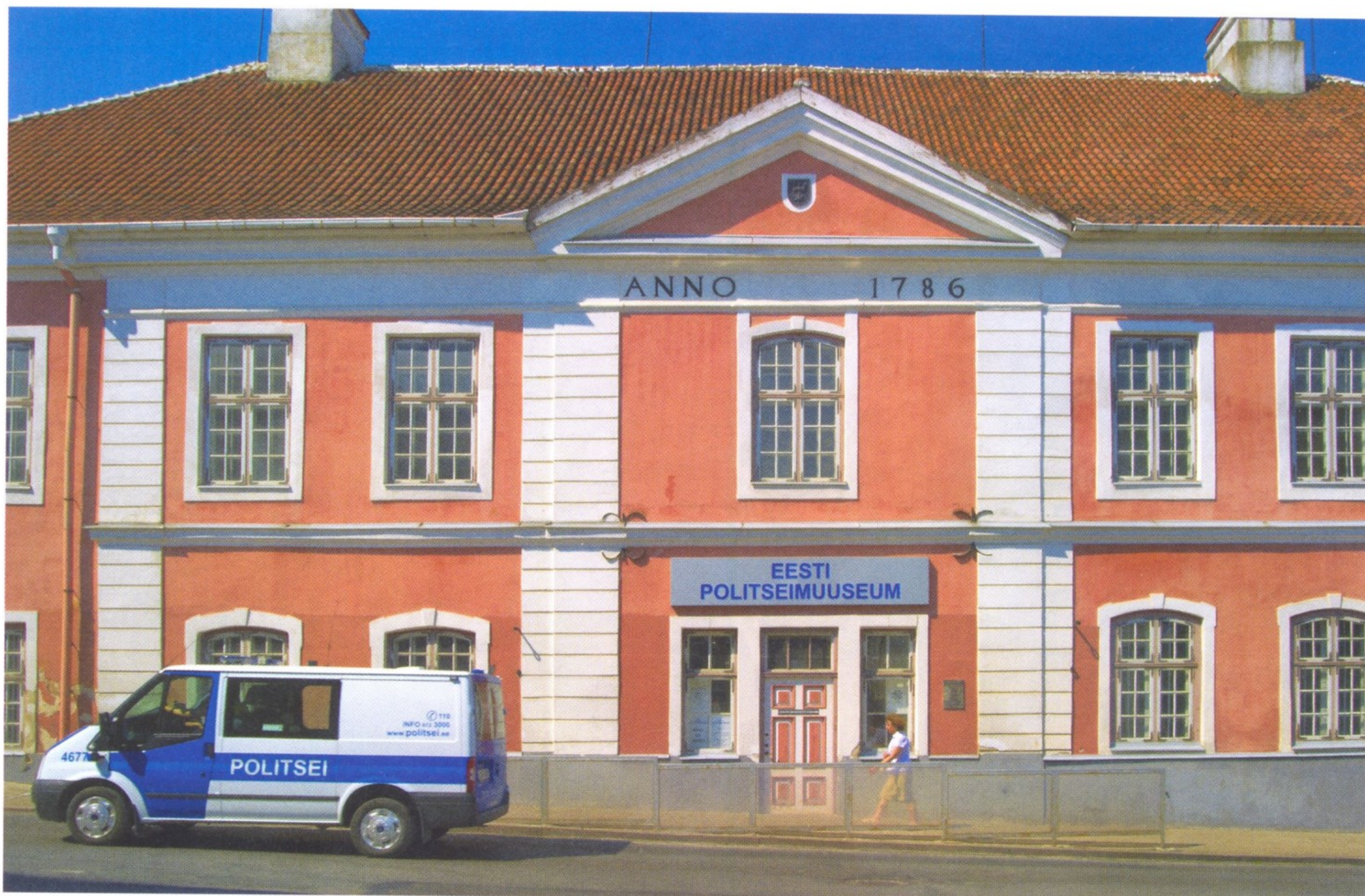
МУЗЕЙ ЭСТОНСКОЙ ПОЛИЦИИ (Г. РАКВЕРЕ)

Самостоятельным структурным подразделением Департамента полиции и пограничной охраны является бюро данных об отмывании денег, которое занимается сбором, регистрацией, обработкой и анализом сведений о нелегальном обороте финансовых средств. Информацию в бюро может прислать любой житель страны — как по почте, так и по Интернету. Есть у Департамента полиции и пограничной охраны и своя философия, заявленная на официальном сайте ведомства: «По сути, полиция является обслуживающей организацией. Наша основная задача — делать со своей стороны все, чтобы в Эстонии жизнь законопослушных граждан была бы как можно безопаснее... Основными ценностями, которыми мы руководствуемся, являются надежность, открытость, партнерство, ориентированность на человека, безопасность, профессионализм, честность и человечность».