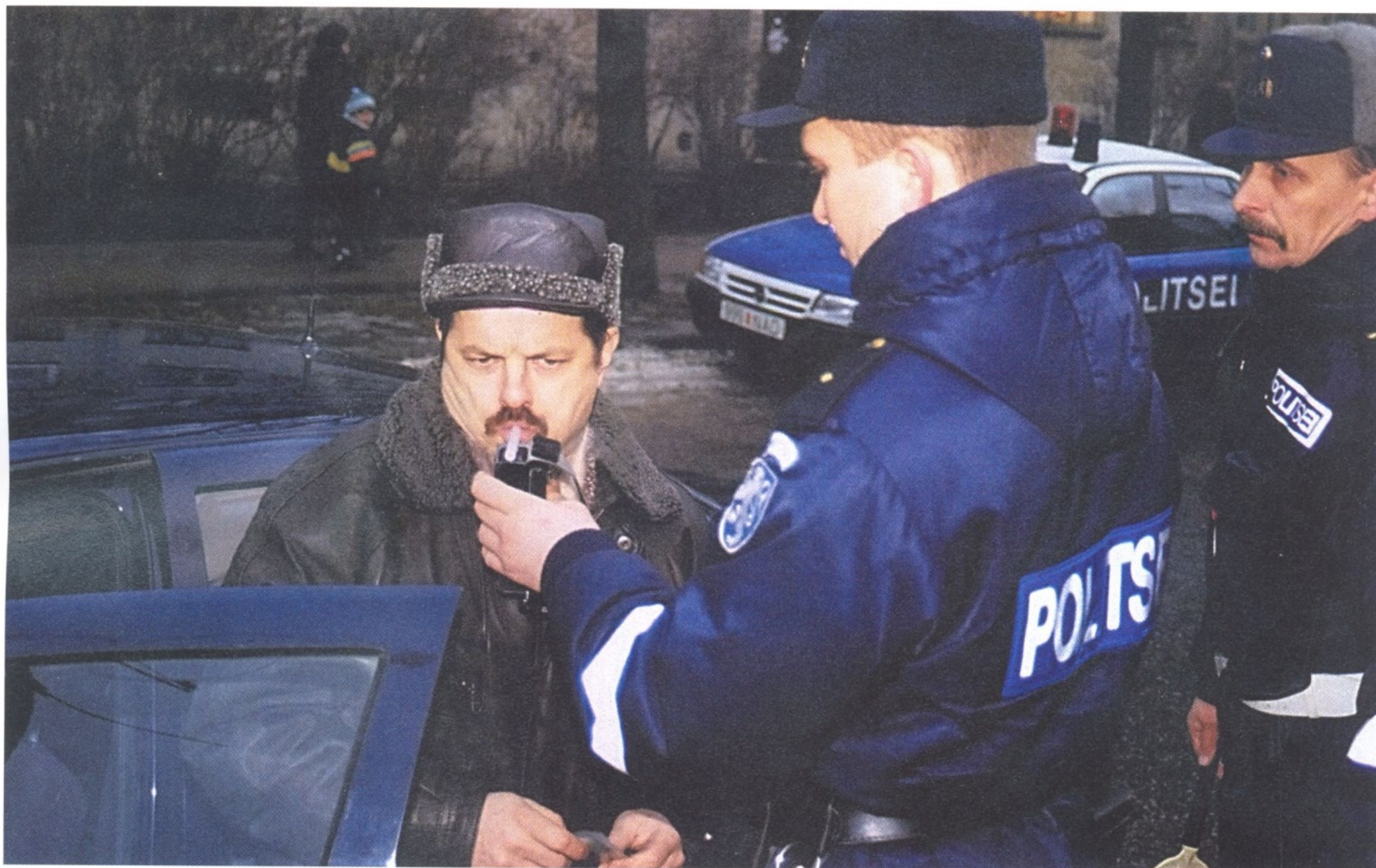
Эстонская полиция проводит операцию по выявлению нетрезвых водителей (Нарва, январь 1999 года)

Эстонская Республика — государство, расположенное на северо-восточном побережье Балтийского моря. Площадь — 45 227 квадратных километров, население — свыше 1,3 млн человек, столица — город Таллин. На протяжении своей истории эстонские земли побывали под управлением нескольких государств, в том числе Швеции, Российской империи и Советского Союза. После распада СССР Эстония восстановила свою государственную независимость. Милиция была переименована в полицию, которая начала свою деятельность 1 марта 1991 года. В тот период эстонская полиция структурно делилась на наружную, дорожную, уголовную и полицию предварительного следствия. Руководство всеми полицейскими силами осуществлял Департамент полиции.