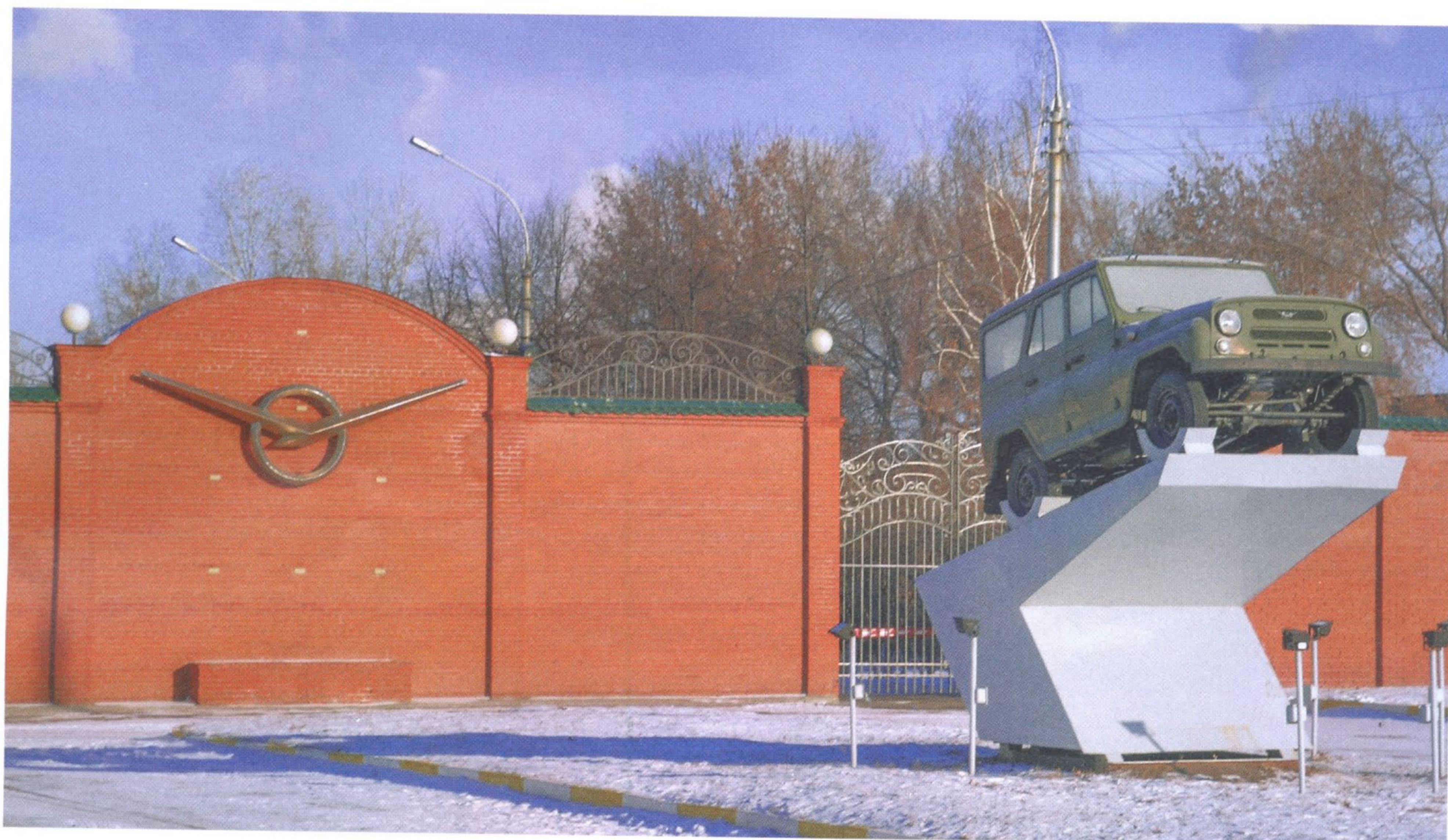
ПАМЯТНИК АВТОМОБИЛЮ УАЗ-469 В УЛЬЯНОВСКЕ

Кузов милицейского автомобиля был разделен надвое специальной перегородкой. Большая часть салона предназначалась для экипажа, а в задней его части был оборудован специальный отсек для задержанных: он был рассчитан на двоих человек и открывался только снаружи.